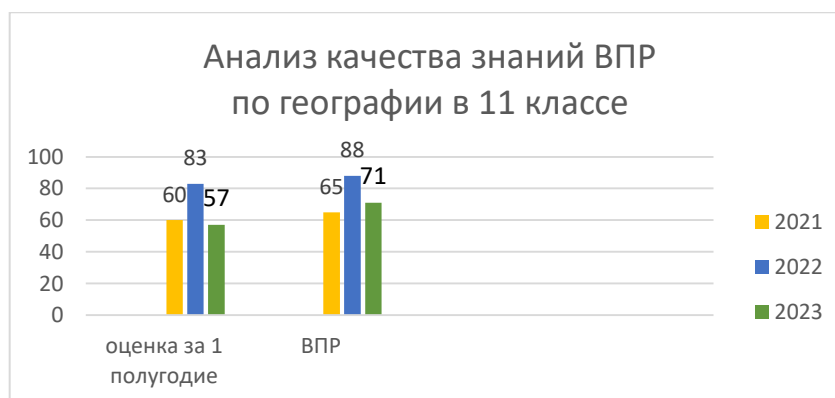
Диаграмма 1. Сравнительный анализ качества знаний ВПР-2022, ВПР-2023 по географии

Сравнительный анализ показал, что качество знаний ВПР -2023 и оценок за 2 полугодие повысился с 57 до 71, но снизился с 88 до 71, по сравнению с результатами ВПР-2022.